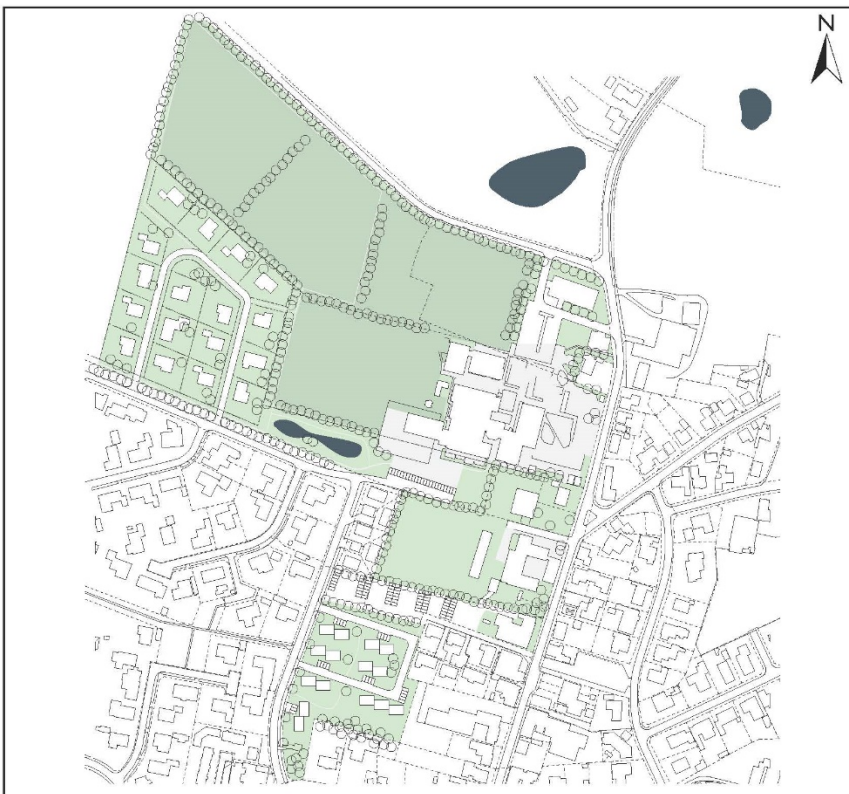
Kort 3 Illustrationsplan iht. forslag til lokalplan 25.01.L02

0 50 100 150m Målförhold 1:3000 (A4) oktober 2015